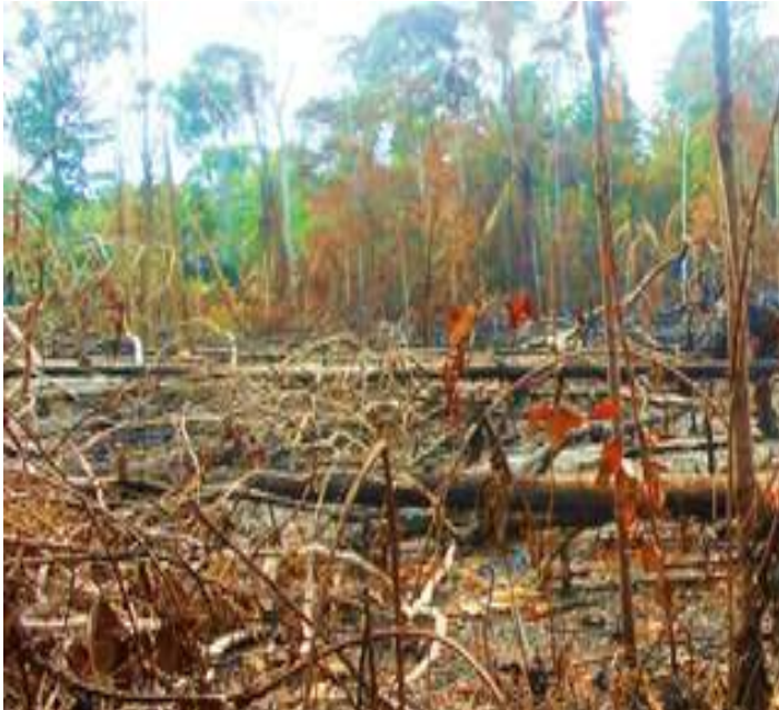
Queimada na Amazônia: derrubar a vegetação com o machado e secá-la para logo queimá-la