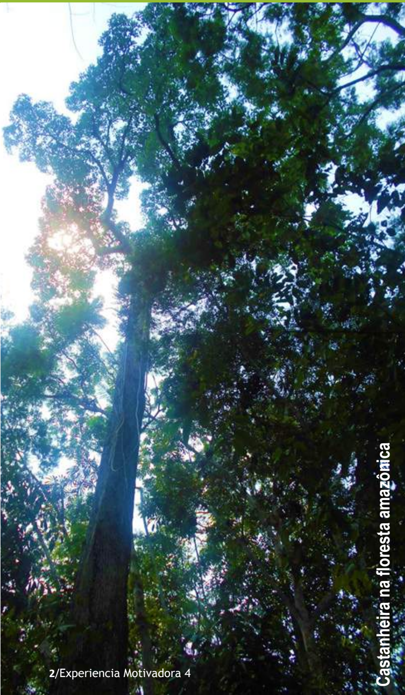
Castanheira na floresta amazônica

A gestão de parcelas com sistemas agroflorestais exige convicção e um contínuo trabalho de cuidados. A situação em que os pioneiros produtores de sistemas agroflorestais amazônicos vivem atualmente demonstra que eles vivem bem, produzindo com a floresta e sem a necessidade de continuar a queimar vegetação. Mas esses casos, caracterizados por uma visão clara da gestão e coexistência sustentáveis, ainda são minoria antes das majorias, que trabalham com lógicas de curto prazo.