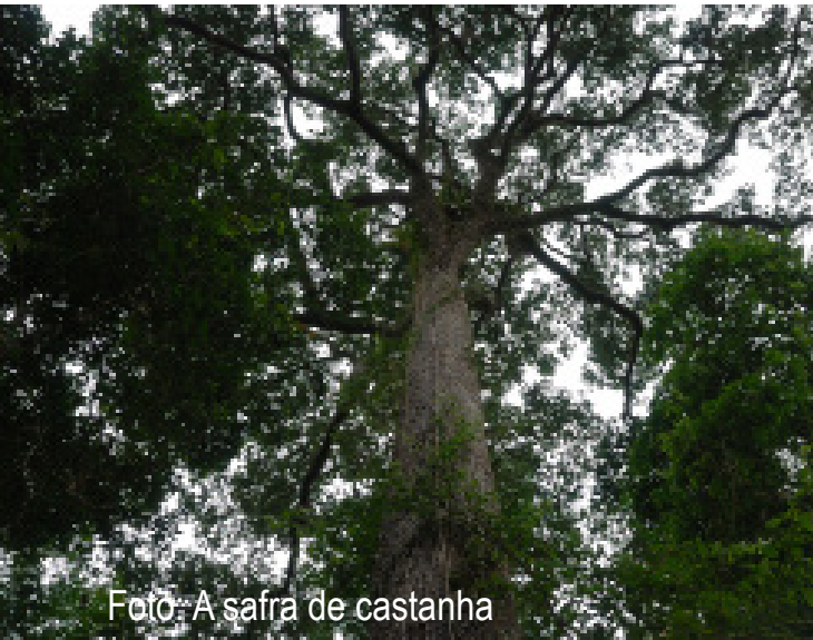
Foto: A safra de castanha

A experiência do território indígena Tacana II e sua organização, em plena Amazônia boliviana é um fiel testemunho de possibilidades de defesa de sua visão de desenvolvimento contra as ameaças de extrativismo. É uma resistência com diálogo e propostas, que afirmam seus direitos enquanto negociam a coexistência com as lógicas de desenvolvimento diferente.