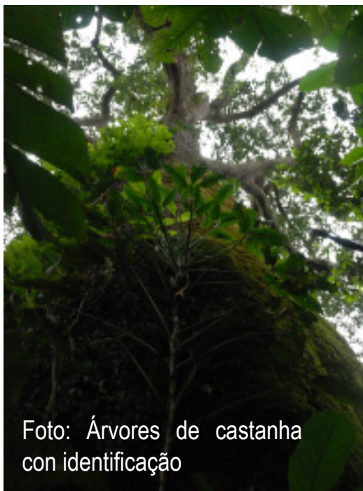
Árvores de castanha con identificación