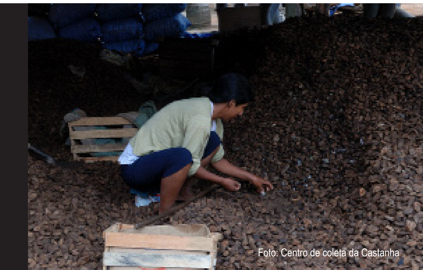
Foto: Centro de coleta da Castanha

A coleta é demorada, porque as árvores estão muito espalhadas. O transporte das castanhas colhidas até o paiol (centro de armazenamento) é realizada sempre que possível com motocicleta, mas muitas vezes também nas costas dos homens. Especialmente nas áreas de uso onde não há acesso direto a uma via navegável, o transporte de castanha torna-se um verdadeiro martírio, e os homens têm que caminhar pela selva por várias horas com até noventa quilos de peso sob os ombros. Para poder passar por águas rasas e palmas (zonas de inundação) é necessário esperar que as chuvas se acalmem e a água baixe. As castanhas são secadas e ao fim da colheita são despachadas pelo rio para Riberalta. Nesta cidade amazônica da Bolívia, a várias centenas